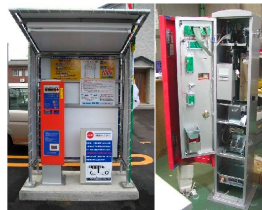
コインパーキング精算機